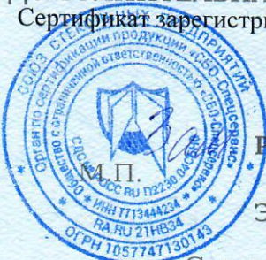
Схема сертификации 2с

Сертификат зарегистрирован на сайте СДС № РОСС RU.П2230.04СБН0 www.sbosp.ru